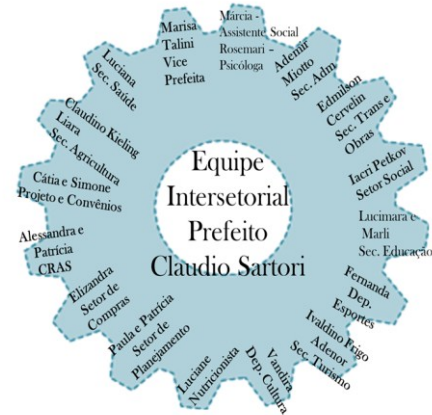
Figura 2: Imagem representativa da Equipe Intersetorial, no município de Presidente Castello Branco (SC)

de gestão ousada, baseado num olhar diferenciado para a administração pública integrada e multidimensional, assinala o prefeito Cláudio Sartori.