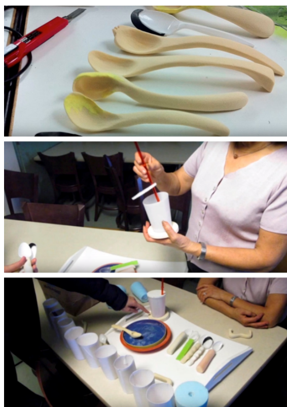
Figura 6: Protótipos de teste

as refeições mais fáceis e dignas para estes idosos. Os usuários diretos do produto são os idosos com deficiências cognitivas, enquanto os cuidadores são aqueles que compreendem de perto às necessidades dos idosos e que, podem muitas vezes, saber expressá-las melhor em palavras, além de terem a experiência na rotina de auxiliar os idosos em sua alimentação, o que explica a importância destes stakeholders no direcionamento e desenvolvimento do projeto. Sha Yao, liderou o desenvolvimento num formato de crowd-design, com a colaboração dos cuidadores e dos idosos, que podem ser considerados desenvolvedores externos deste projeto. Enquanto o papel do público alvo do projeto foi auxiliar na definição do produto, relatando necessidades, testando protótipos (Figura 6), o papel da designer foi materializar soluções para esta necessidade, de acordo com parâmetros de produção, visando a viabilidade produtiva deste projeto.