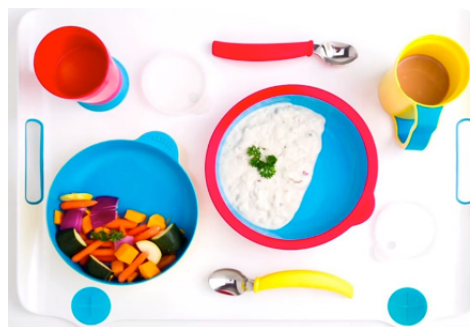
Figura 1: O conjunto de mesa Eatwell

Eatwell é um conjunto de mesa para pessoas com deficiências cognitivas, como doença de Alzheimer e demência (Figura 1). O projeto ganhou o 1º lugar no Design Challenge “Maximizing Independence for those with cognitive impairment” (Maximização da independência para aqueles com comprometimento cognitivo, em tradução livre) promovido pelo Stanford Center on Longevity.