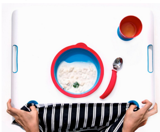
Figura 5: Vista superior da bandeja

O conjunto também vem com uma bandeja que permite aos usuários usar um babador para ajudar a recolher qualquer alimento que caia fora do prato (Figura 5).