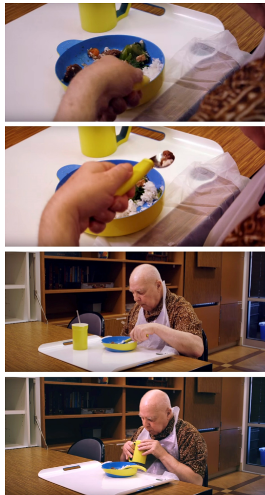
Figura 7: Idoso utilizando o conjunto de mesa Eatwell

Dentre 52 equipes de 15 países, o Eatwell conquistou o 1º lugar no desafio e passou a receber suporte do Stanford Center on Longevity e da Aging 2.0 (Figura 7).