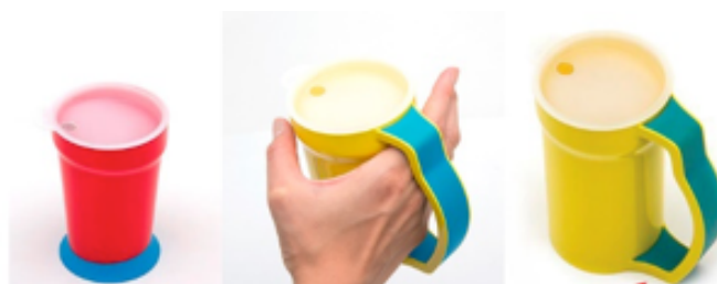
Figura 3: Copo e caneca do Eatwell

O copo possui uma base de borracha que atua como estabilizador. A caneca possui uma alça que se estende até sua base como suporte adicional. A alça é também especialmente projetada para auxiliar os usuários com artrite (Figura 3).