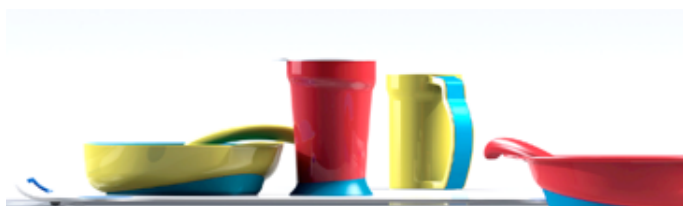
Figura 4: Vista lateral do conjunto de mesa Eatwell

Todos os produtos possuem material anti-deslizante na parte inferior (Figura 4).