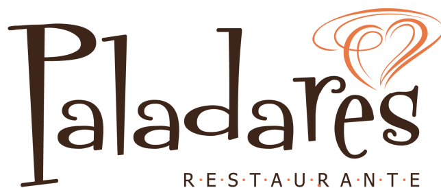
Figura 5: Marca Paladares

Porém, um restaurante necessita também transmitir segurança e limpeza. Desta forma, para finalizar a marca, foi escolhida uma tipografia séria, sem serifa e em caixa alta para ser utilizada como assinatura (Restaurante). Foram definidas, também, duas cores que transmitissem tanto os sentimentos quanto a segurança representados na marca. Laranja para os grafismos, representando o calor das emoções e sentimentos; e marrom para a tipografia, relacionado diretamente à segurança.