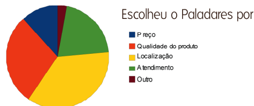
Figura 3: Ítem avaliado na dimensão Paladares

Desse modo, para construção da marca Paladares, diversos fatores tangíveis e intangíveis foram levados em consideração, iniciando-se pela busca do conceito que representa o DNA do restaurante.