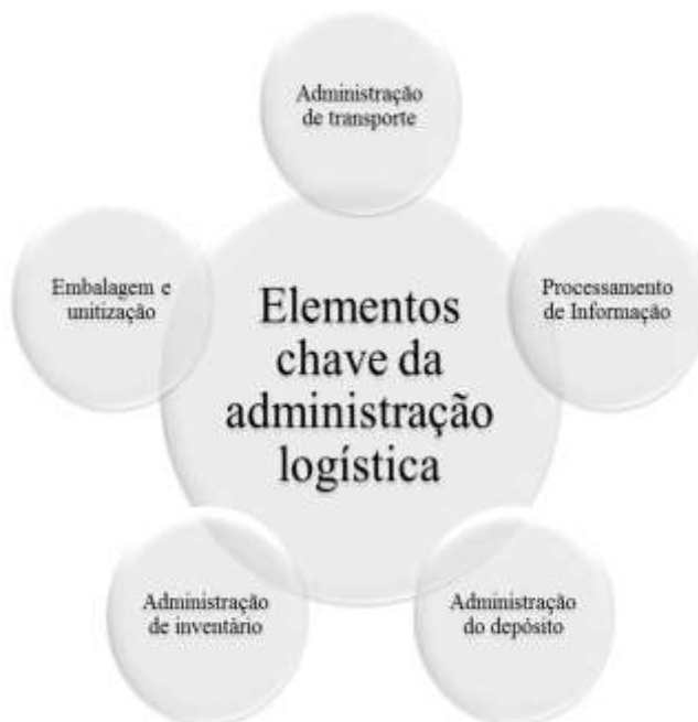
Figura 1 – Elementos chave da administração logística