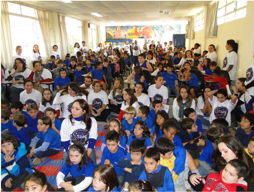
Figura 1 – Abertura, 11/66/2012.