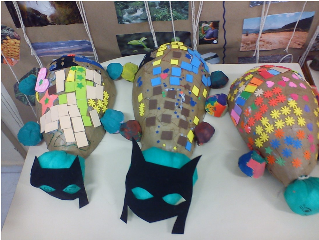
Figura 2 - Oficina "Pensareco, é lógico", 13/06/12.