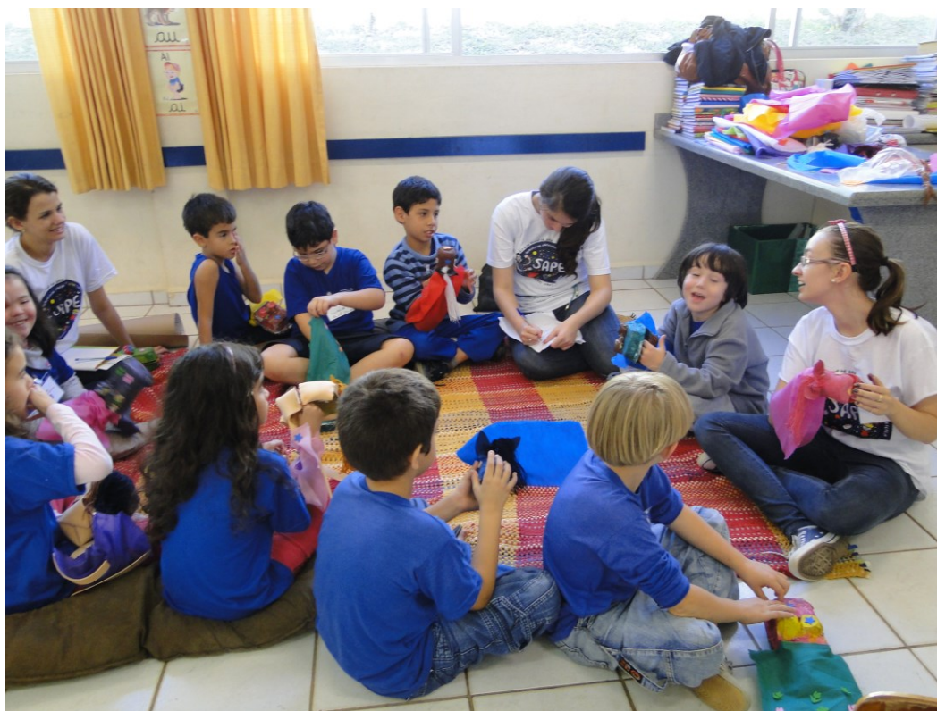
Figura 3 - Oficina de Fantoches, 13/06/12.