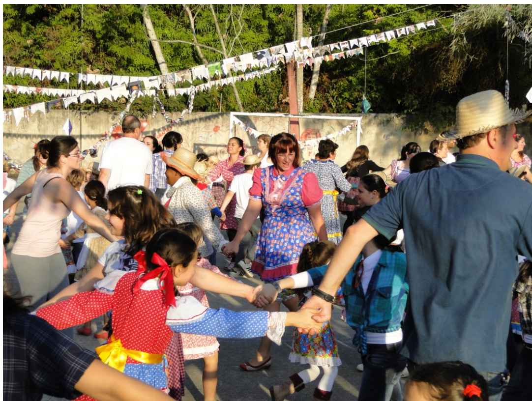
Figura 5 - Festa Junina, 15/06/12.