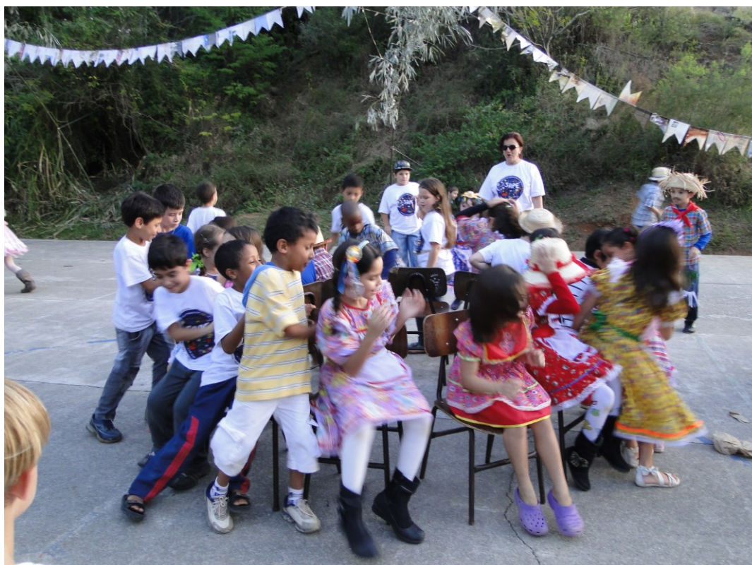
Figura 4 - Festa Junina, 15/06/12.